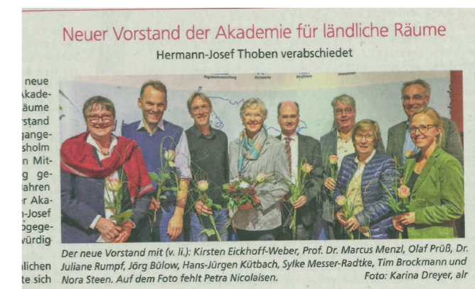
Bauernblatt, 41. Ausgabe 2022

Die Aktivitäten der Akademie und des Netzwerks werden von der Presse und auch vom Bauernblatt SH begleitet.