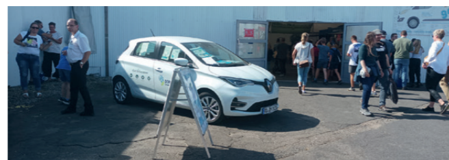
Das Dörpsmobil aus Schwedeneck auf der NORLA 2022

Das Projekt beinhaltet 3 große Bausteine: