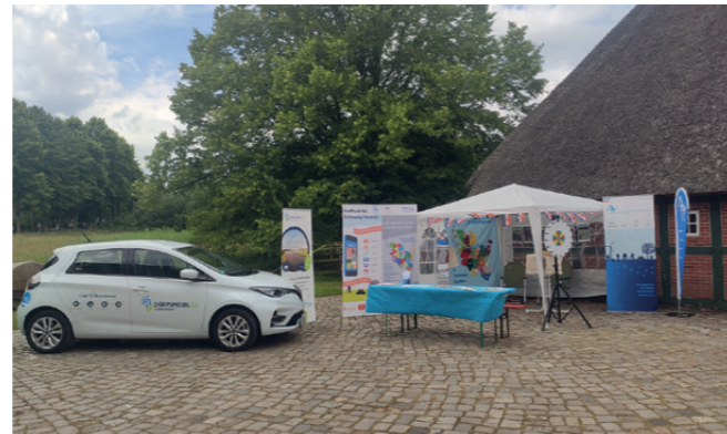
„Dörpsmobil“ aus Schwedeneck am Tag der SH im Freilichtmuseum Molfsee, Foto: Matthiesen

mobil-Projekt im ganzen Land dabei und fand großes Interesse bei Besucherinnen und Besuchern – wie zum Beispiel bei der landesweiten Sternfahrt der Dörpsmobile SH nach Schacht- holm oder auf der NORLA Messe in Rendsburg.