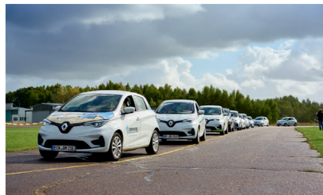
„Sternfahrt der „Dörpsmobile SH“ Sternfahrt der Dörpsmobile am 2. Oktober 2022 nach Schacht- holm Unter der Schirmherrschaft von Ministerpräsident Daniel Günther