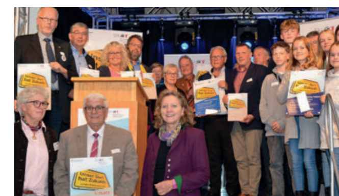
Ausgezeichnet wurden die Gewinnerinnen und Gewinner des Landes-Wettbewerbs von der Staatssekretärin für Ländliche Räume Anne Benett-Sturies

Der erstmals vergebene Sonder-Preis „Kinder- und Jugendarbeit“ der Akademie für die Ländlichen Räume Schleswig-Holsteins e.V. (ALR) und des Schleswig-Holsteinischen Gemeindetags e.V. (SHGT) wurde an die Gemeinde Grundhof (Kreis Schleswig-Flensburg, 916 Einwohner*innen) verliehen.