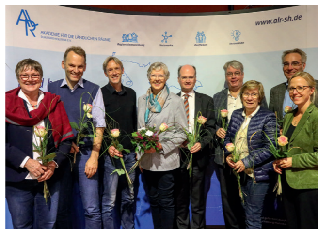
Es fehlt Petra Nicolaisen, Foto: K. Dreyer

Die Vorstandsmitglieder werden auf der Mitgliederversammlung für 3 Jahre gewählt. Die aktuelle Wahlperiode erstreckt sich auf die Jahre 2022 bis 2025.